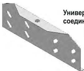
Универсальный соединитель 1