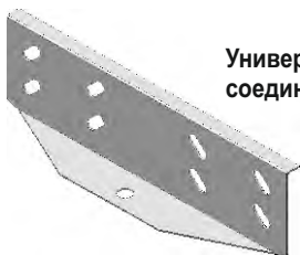
Универсальный соединитель 2